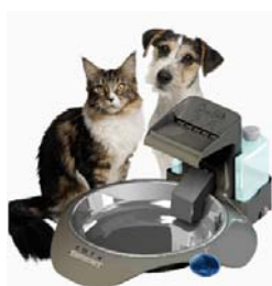
SmartLink™ Waterer Intelligent Water Fountain