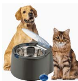
SmartLink™ Feeder Intelligent Pet Bowl