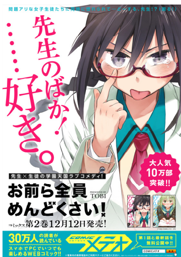
「お前ら全員めんどくさい！」駅貼り広告