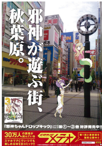
「邪神ちゃんドロップキック」 駅貼りポスター ※全 8 種類