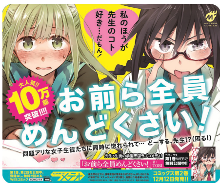
「お前ら全員めんどくさい！」車両ステッカー広告